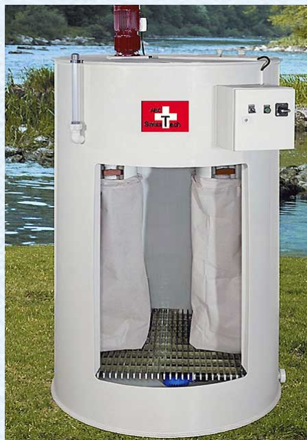
Dimensions : 3000 × 2000 × 2300 mm

Pour le traitement des effluents, ABC SWISSTECH a développé des solutions simples et compactes ayant pour objet de réduire au maximum le temps lié à l'exploitation de l'installation.