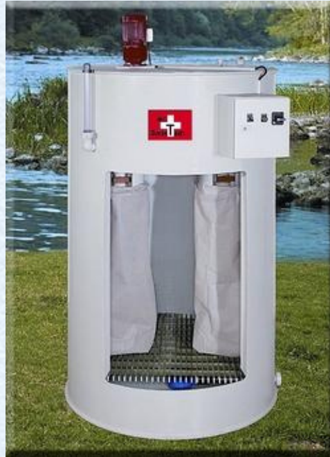
Dimensions : 3000 × 2000 × 2300 mm

Pour le traitement des effluents, ABC SWISSTECH a développé des solutions simples et compactes ayant pour objet de réduire au maximum le temps lié à l'exploitation de l'installation.