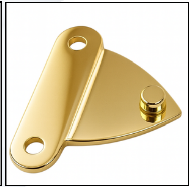
Comparatif des différents équipements :